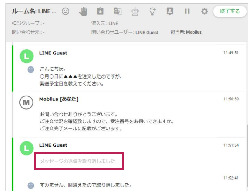
オペレーター：チャットタイムライン